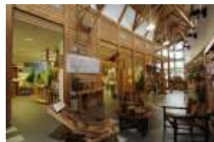
Action B.1, priorité +++ Action B.2, priorité ++ Action B.3, priorité +