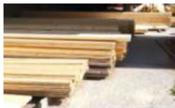
Action D.1, priorité +++ Actions D.2 et D.3, priorité ++ Action D.4, priorité + Action D.5, priorité -