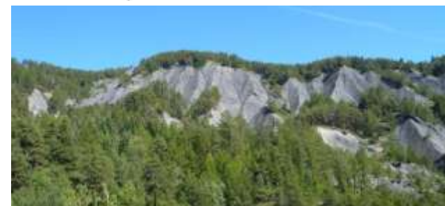
Pins sur terrains instables (Riou-Bourdoux)