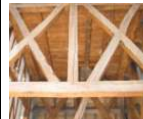
Actions C.1 et C.2, priorité ++