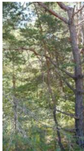
Peuplement de pins (Barles)