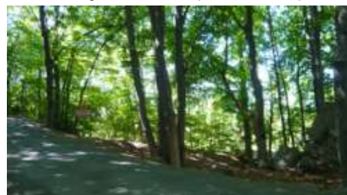
Forêt de hêtres (Pontis)