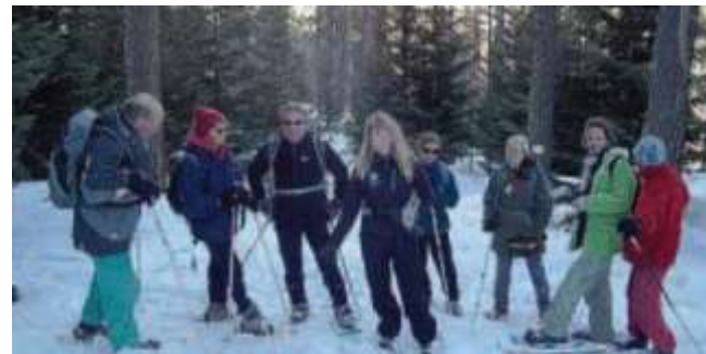
© Le Dauphiné – 18/01/2012, G Kletty