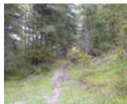
Actions E.1 à E.5, priorité ++ Action E.6, priorité + Actions E.7 et E.8, priorité -