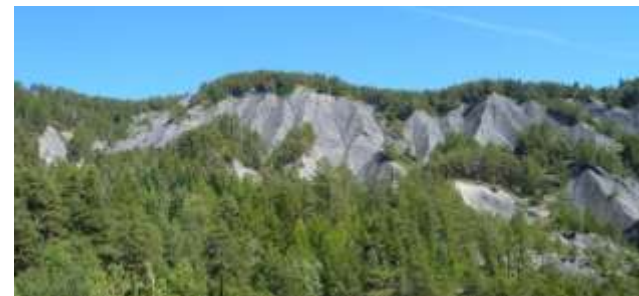
Pins sur terrains instables (Riou-Bourdoux)