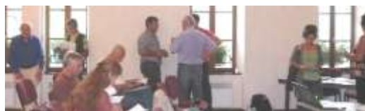
Action A.1, priorité +++