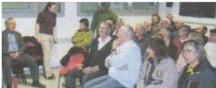
© La Provence – 24/01/2012, S. B.