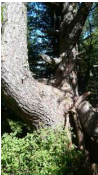
Mélèze Remarquable (Pontis)