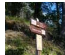
Action F.1, priorité + Action F.2, priorité -