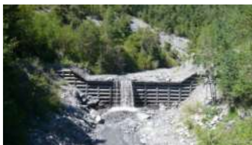
Barrage RTM en bois (Riou-Bourdoux)